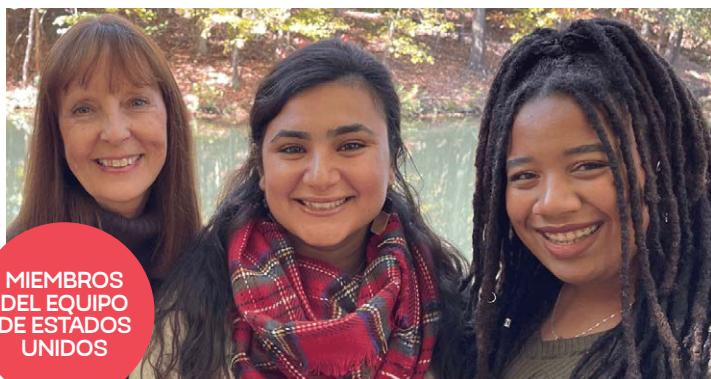
MIEMBROS DEL EQUIPO DE ESTADOS UNIDOS

profundo y personal amor por Cristo y abracen una lectura regular de las Escrituras, arrepentimiento y obediencia a ti. (Col. 1:10)