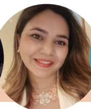
MIEMBROS DEL EQUIPO DE BONAIRE, MÉJICO Y PARAGUAY