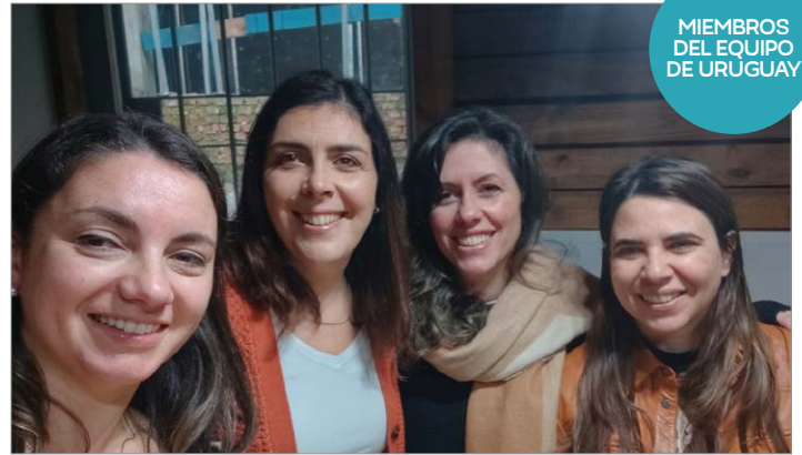
MIEMBROS DEL EQUIPO DE URUGUAY

14. Señor, protege a las familias en Bonaire ,